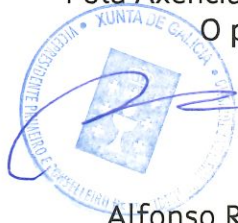
Alfonso Rueda Valenzuela

Pola Axencia Turismo de Galicia O presidente