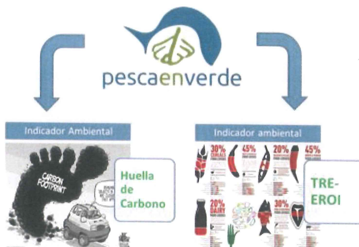
Figura 1. Indicadores ambientais incluídos na ecoetiqueta/marca pescaenverde