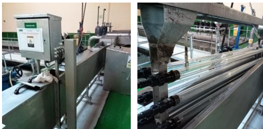
Figura 6 Vista xeral da desinfección (esquerda) e lámpadas UV da desinfección (dereita)

Cando se supera a capacidade de evacuación por gravidade (en situación de caudais elevados ou preamares altas), parte do efluente desinfectado reborda dende a saída do equipo UV á cámara de bombeo do emisario, onde se impulsa (mediante 2 bombas) este caudal.