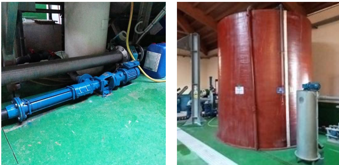
Figura 8 Bomba de purga de lamas procedentes do DAF (esquerda) e espesador estático (dereita)

Os lodos separados por flotación ou sedimentado extraído polo parafuso varredor de fondo da cámara de flotación, impúlsase mediante bomba helicoidal cara un depósito de lodos vertical de almacenaxe, dosificando cloruro férrico para a minimización de olores.