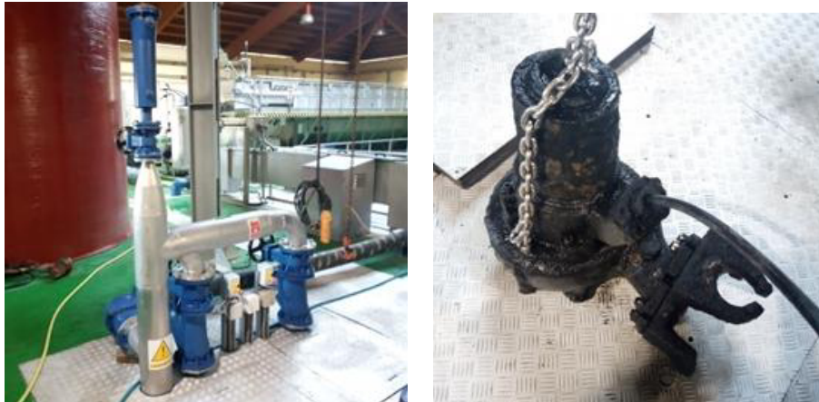
Figura 7 Vista xeral da impulsión da condución de vertido (esquerda) e bomba N°2 en impulsión da condución de vertido (dereita)