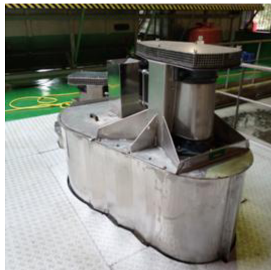
Figura 2 Vista xeral tratamento biolóxico (esquerda) e sistema CELPOX de aireación-axitación (dereita)

O vertido tratado cae nun pozo de bombeo a físico-químico no que se instalan dúas (2) bombas somerxibles, encargadas de elevar a auga ata un sistema de tratamento por flotación (DAF). A auga vertida ponse en contacto con coagulante e floculante, mediante a inxección en liña dos mesmos. A mestura íntima de reactivos e auga residual realízase na cámara de coagulación e floculación, equipadas con axitadores rápidos e lentos, respectivamente. Desta maneira promóvese a formación e crecemento do flóculo.