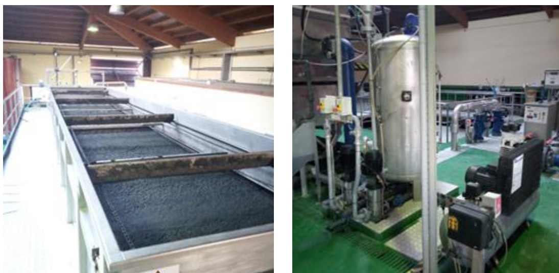
Figura 5 Sistema DAF (esquerda) e sistema DAC para xeración de microburbullas (dereita)

O vertido clarificado sae do tanque de flotación e cae por gravidade ata a entrada ao canal onde se localiza o equipo de desinfección UV. Unha vez desinfectado o efluente, este chega por gravidade para ser evacuado a través do a condución de vertido (comunmente denominada emisario submarino, se ben non cumpre os requisitos de lonxitude para ser considerado un emisario). A pesar de recibir esta denominación no proxecto construtivo e posteriores modificacións, este non cumpre as características de emisario submarino, axustándose á definición de condución de vertido. Manterase a primeira das denominacións en todo o documento a fin de dar continuidade aos anteriores escritos.