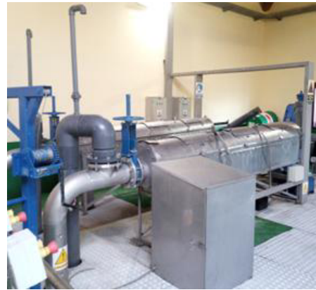
Figura 1 Bomba N°2 de cabeceira (esquerda) e vista xeral dos filtros tipo Masko Zoll (dereita)

Dende este pozo, a auga pasa polo punto de desbordamento cara o tratamento biolóxico, composto por dúas cámaras separadas por un muro intermedio. A auga residual entra na zona anóxica e circula coa axuda dun circulador somerxible cara a cámara aerobia, onde se introduciu un soporte no cal se fixa a biomasa. A aireación na zona aerobia e a circulación entre os dous canais conséguense mediante un sistema CELPOX colocado no medio da cámara aerobia.