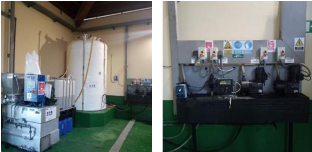
Figura 4 Depósito de coagulante e preparador de floculante (esquerda) e bombas de membrana e dosificación (dereita)

O coagulante almacénase nun depósito vertical e dosifícase mediante dúas bombas (1+1) bombas de membrana. O floculante prepárase nunha estación automática e inyéctase mediante dúas (1+1) bombas de dosificación.