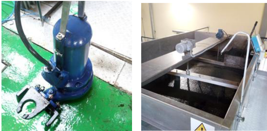
Figura 3 Bomba N°2 en bombeo a FQ (esquerda) e cámara de coagulación e floculación (dereita)

O coagulante almacénase nun depósito vertical e dosifícase mediante dúas bombas (1+1) bombas de membrana. O floculante prepárase nunha estación automática e inyéctase mediante dúas (1+1) bombas de dosificación.