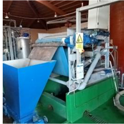
Figura 9 Bomba de espesador a filtro banda (esquerda) e filtro banda (dereita)

A mestura trátase no filtro banda e obtense por unha parte un deshidratado que cae cara a tolva da bomba de fango deshidratado, que impulsa este cara un contedor, e en segundo lugar un escorrido que retorna a cabeceira de planta.