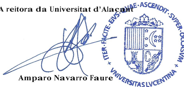
Amparo Navarro Faure